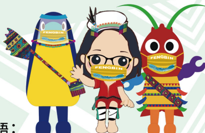
豐濱鄉長 江莉婷(Panay Lisin)