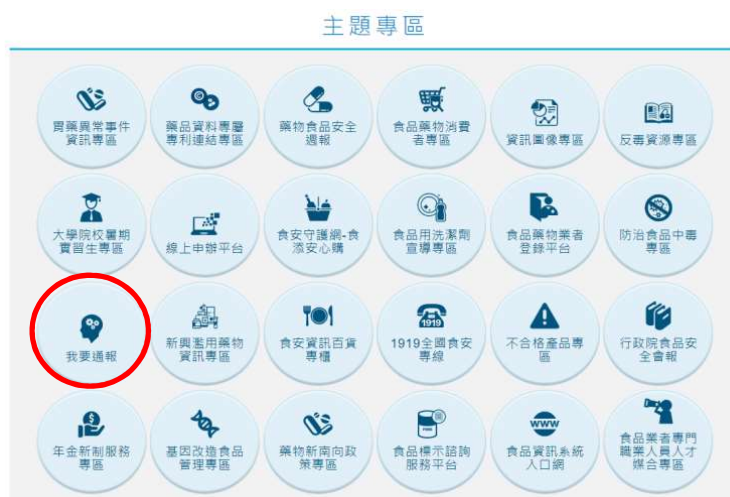
圖 1a. 食品業者進入食藥署官網下方主題專區，點選「我要通報」。