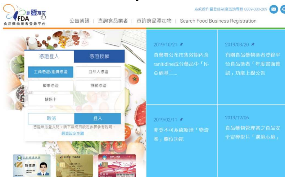
圖 3a. 食品業者以憑證方式登入「非登不可」系統。