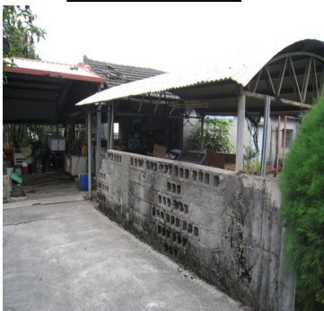
加蓋鐵皮屋及圍牆