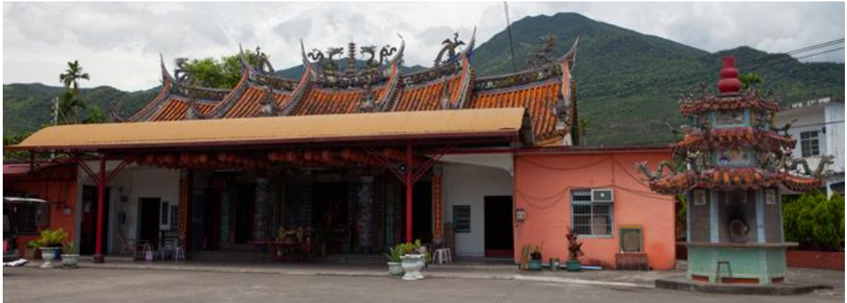
圖 5-2-1 綱要計畫 2.1 保安宮示意圖